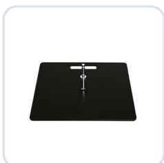
Markplatta L, 10 kg