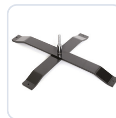
Kryssfot utomhus XL