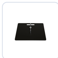
Markplatta M, 5 kg